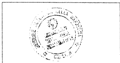
Cachet official de l'Autorité Régionale.