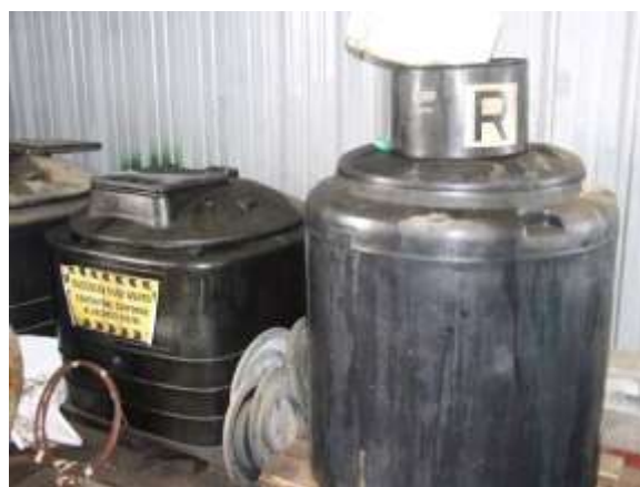
Foto 1. Contenitori per oli e batterie esauste

Gli oli usati e le batterie esauste invece sono smaltiti direttamente dai detentori attraverso i contenitori situati in apposito locale all'interno del cantiere nautico del porto (foto 1).